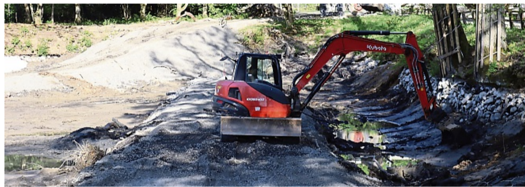
Schweres Gerät und geschützte Eichen: Der Landgrafenteich bleibt in Grün eingebettet und wird mit Sitzterrassen ausgestattet.

schfenster sind derzeit ausgebaut und werden in einem Fachbetrieb in Thüringen restauriert. Nach ihrem Wiedereinbau folgt die Fassadensanierung.